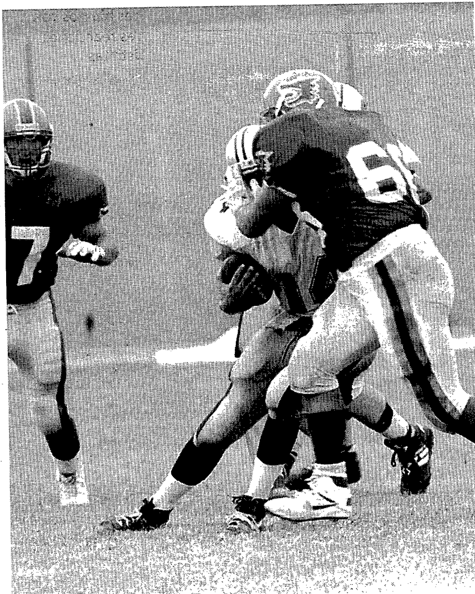
Los Howlers le pudieron a los Panteras • El equipo de Barcelona se impuso al de Madrid por un ajustado 18-12 en la final de siete contra siete • FOTO: RODOLFO MOLINA

La final de Challenge American Bowl la jugaron Howlers de Barcelona contra Panteras de Madrid, dos rivales históricos. Volvieron a ganar los Howlers por un ajustado 18-12, un solo touchdown de diferencia.