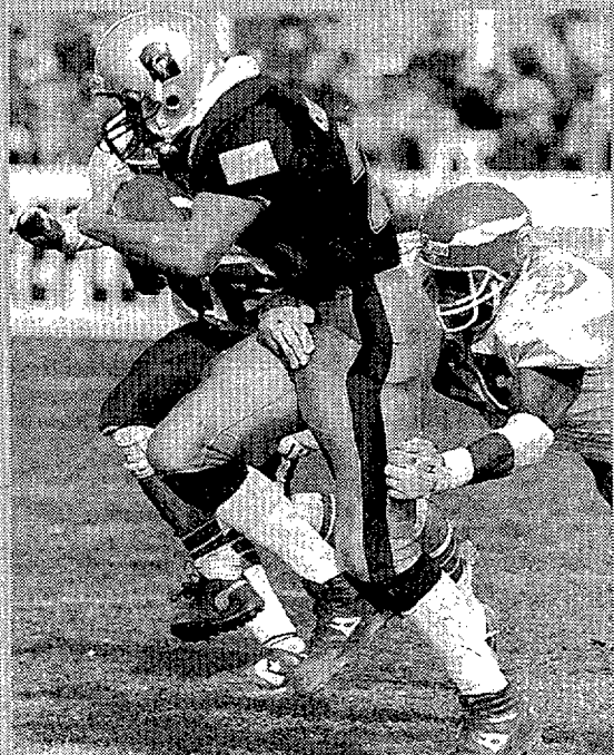
Los Panteras ganaron 'in extremis' • El derbi madrileño fue emocionante • FOTO: PEP MORATA

Los Osos no tardaron en remontar el marcador y