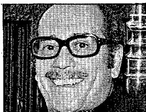
J. L. López Vázquez en TVE-1